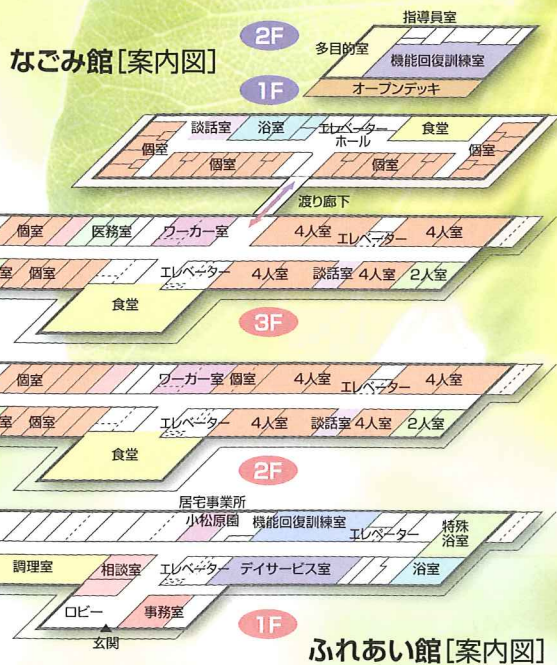
ふれあい館 [案内図]

ご家族の方が病気や休養・冠婚葬祭などで介護にお困りの時、替わってご希望の日数だけ、ご自宅におけるとおなじようなお世話をいたします。(要支援・要介護の認定を受けている方が、ご利用できます。)