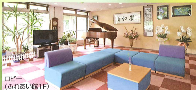
ロビー (ふれあい館1F)