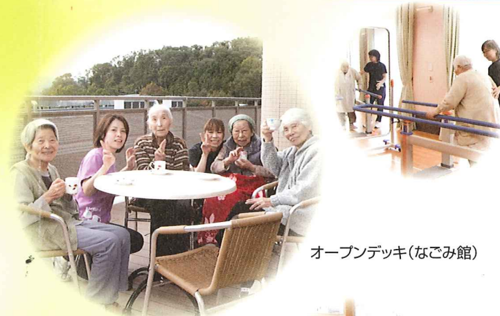
オープンデッキ(なごみ館)