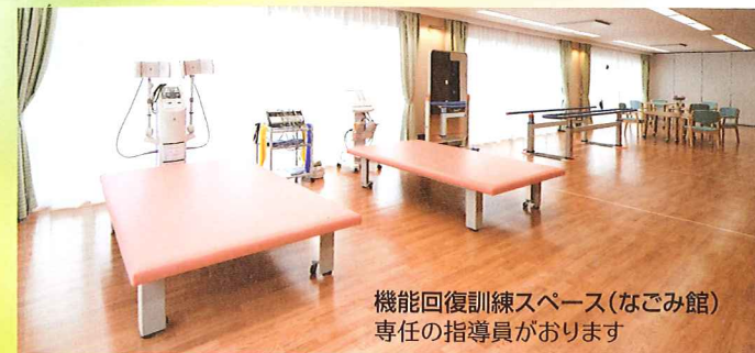
機能回復訓練スペース(なごみ館) 専任の指導員がおります

当園は、ご家族の協力を得て、利用者ひとり一人のニーズを的確に把握し、その方にふさわしいケアを提供します。