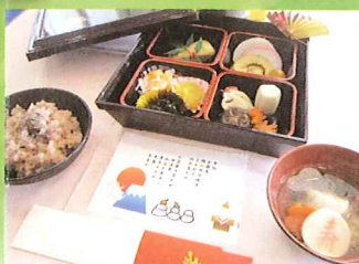
お食事(行事食・おせち料理)