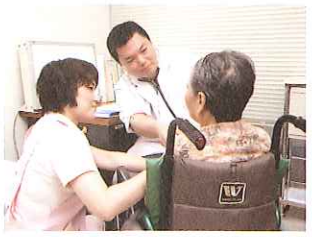
医務室(ふれあい館)