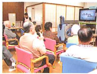
デイルーム カラオケが楽しめます