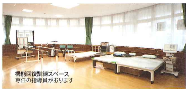
機能回復訓練スペース 専任の指導員がおります