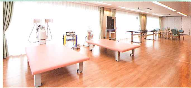
機能回復訓練スペース(なごみ館)専任の指導員がおります