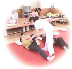
● 指定居宅介護支援事業所 小松原園