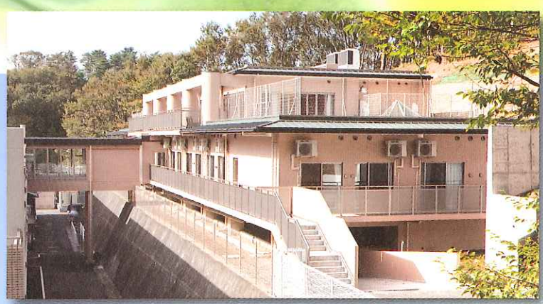
小松原園なごみ館