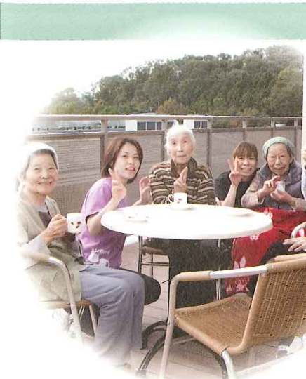
オープンデッキ(なごみ館)