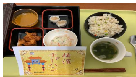
駅弁 横浜チャーハン