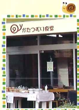
八王子市役所前郵便局の真向かいの薄いレモン色の建物です。